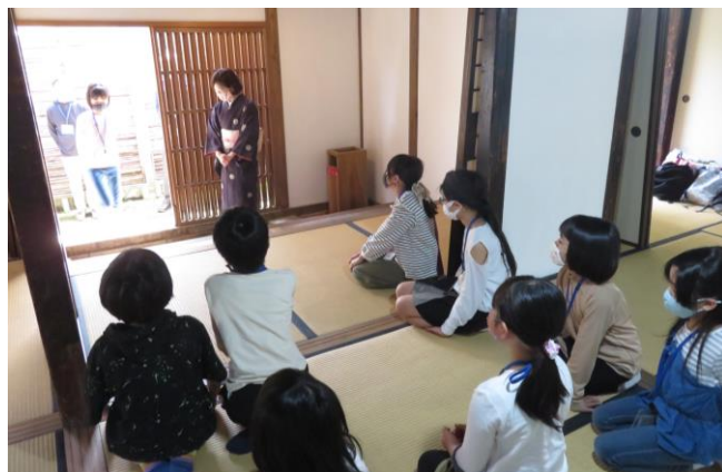
礼儀作法 訪問時の作法