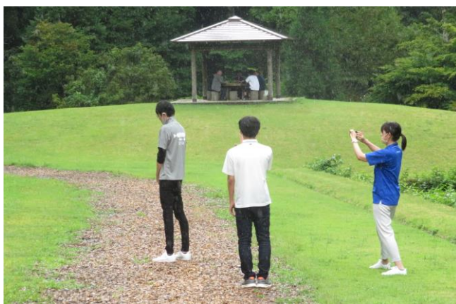
飯南町PR動画づくり