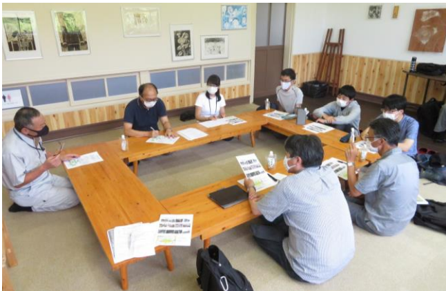
地域の現状と地域づくりの取り組み