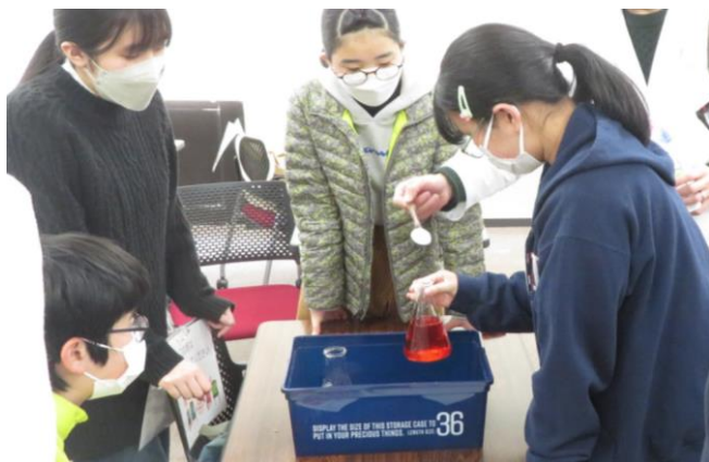
科学の実験 身近な指示薬