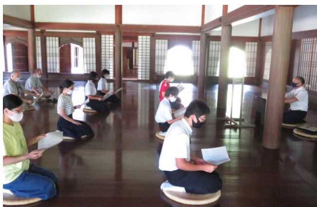
閑谷学校講堂 論語素読体験