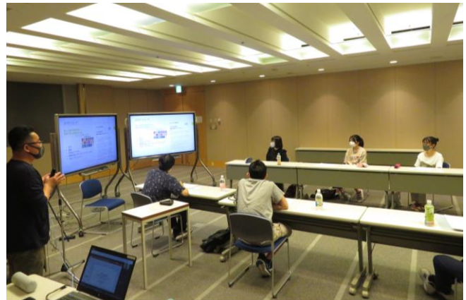
それでも地球で生きていきますか？ ～世界を変革する17の目標～