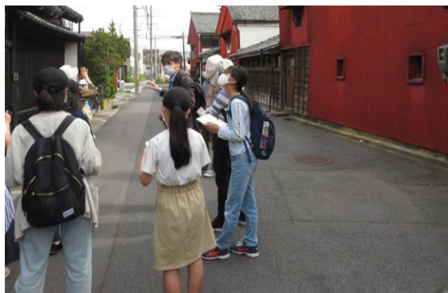
松江歴史探索 橋北編