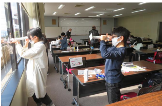
科学の実験工作 レンズの仕組み