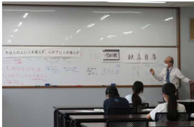
偉人学習 福沢諭吉