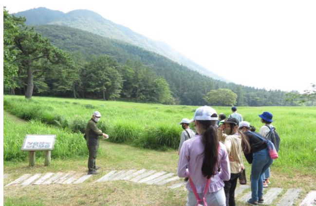
三瓶自然体験学習